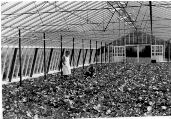
Det første drivhus

Om vinteren havde min far i mange år arbejde som murerarbejdsmand på sukkerkogeriet, når roekampagnen gik ind, ligesom han i flere år arbejdede på Morud frugtlager.