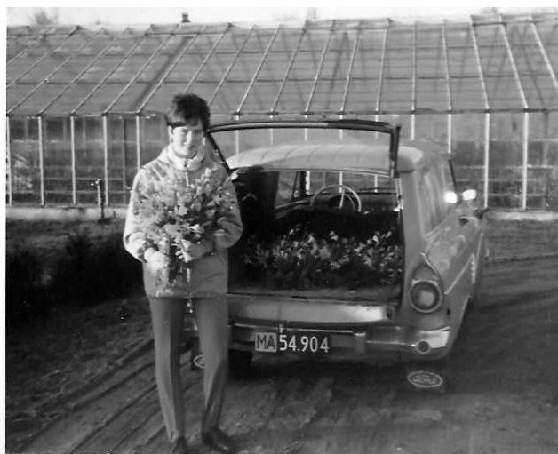
Den nye bil fyldt med blomster

I 1960 fik mine forældre bil, en grøn Taunus varevogn på papegøjeplader. Det var en stor dag, da vi fik den, idet vi hidtil havde cyklet eller taget toget, når vi skulle besøge familien