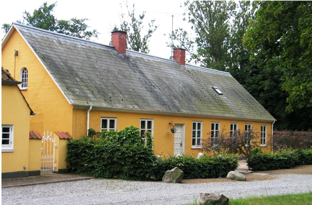
Den gamle rytterskole nu

Nr. 97 A. Breve fra forskellige 1713-30.