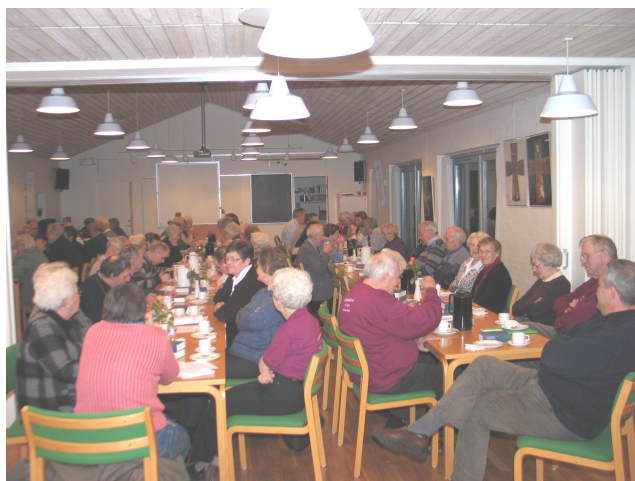
Fra generalforsamlingen i 2008